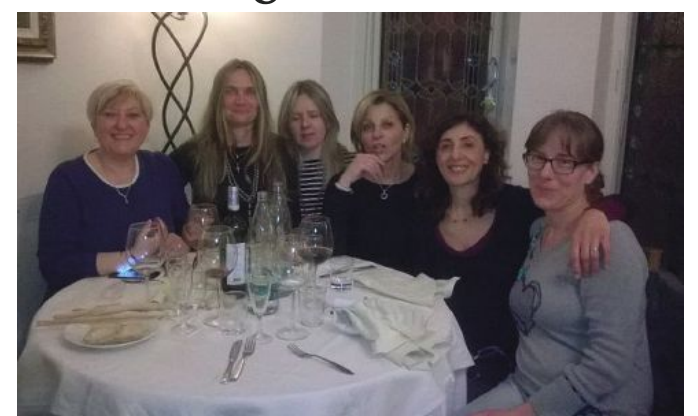
TANTI I PARTECIPANTI Due momenti della cena a favore della Lida