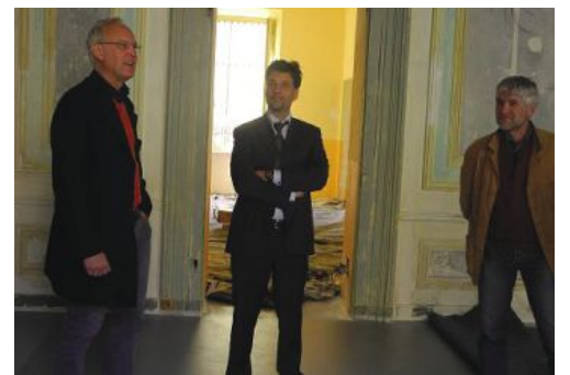
Due momenti della presentazione dei restauri